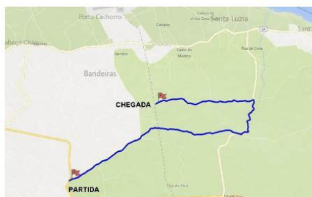
PE 3 / 5 / 7 ALTO BARREIRO / SANTA LUZIA