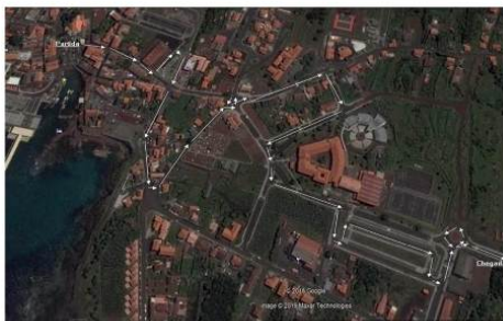
PE 1 LARGO CARDEAL COSTA NUNES / AREIA LARGA