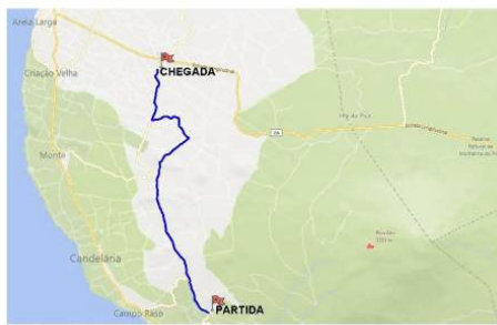
PE 2 / 4 GINGEIRAS / CABEÇO GRANDE